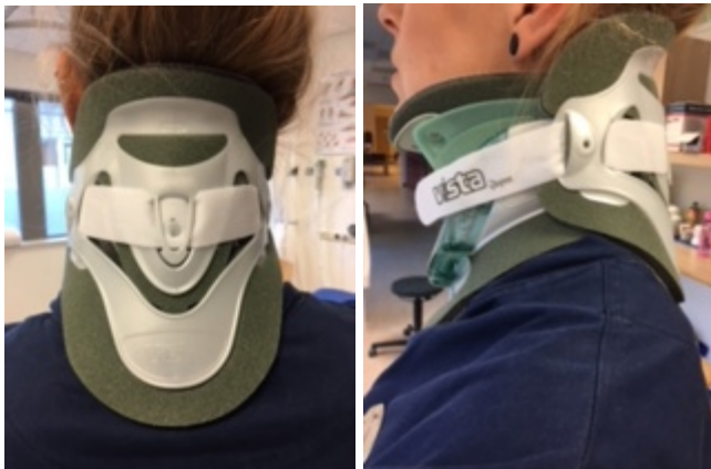
Vista nekkraag: voorkant, zijkant en achterkant