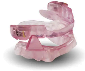
Mandibulair Repositie Apparaat (MRA)