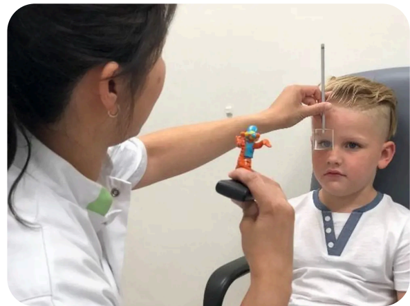
Beoordelen van oogstand en oogbewegingen

Hiervoor moet uw kind naar een lichtje en/of een poppetje kijken. Afwisselend dekt de orthoptist één oog van uw kind kort af.