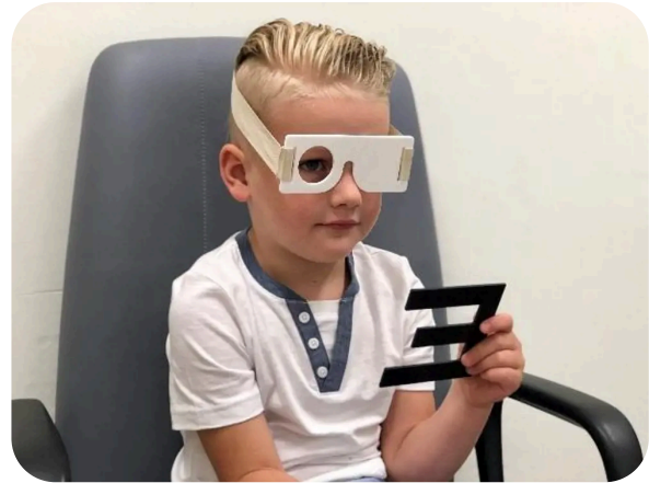
Het bepalen van de gezichtsscherpte

de orthoptist test elk oog afzonderlijk. Uw kind moet hiervoor een speciale bril opzetten. Afhankelijk van de leeftijd en het ontwikkelingsniveau van het kind gebruikt de orthoptist hiervoor plaatjes, figuren, letters of cijfers.