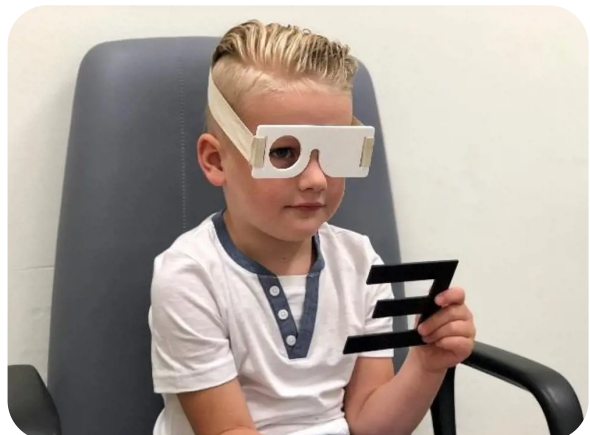
Het bepalen van de gezichtsscherpte

de orthoptist test elk oog afzonderlijk. Uw kind moet hiervoor een speciale bril opzetten. Afhankelijk van de leeftijd en het ontwikkelingsniveau van het kind gebruikt de orthoptist hiervoor plaatjes, figuren, letters of cijfers.