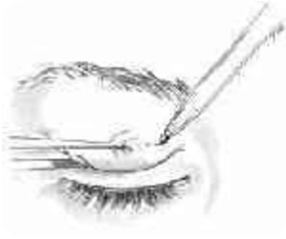
1. Markeren van het te opereren gebied

Een ooglidcorrectie vindt poliklinisch plaats onder plaatselijke verdoving en duurt ongeveer 30 minuten. Tijdens de operatie verwijdert de plastisch chirurg een strookje huid en haalt indien nodig ook een stukje spier- en vetweefsel weg. Na de operatie gaat u kort naar een andere kamer om uitleg te krijgen over het koelen van de oogleden.