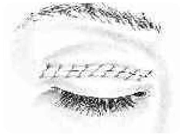
4. Sluiten van de wond met een voortlopende hechting